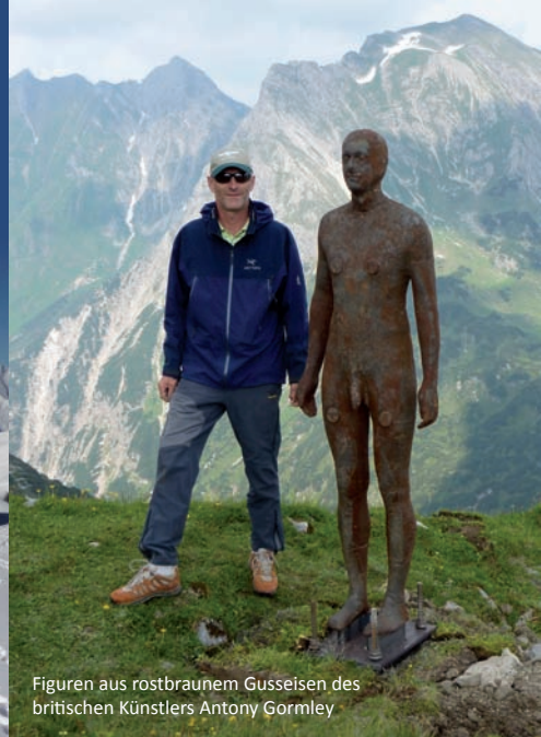
Figuren aus rostbraunem Gusseisen des britischen Künstlers Antony Gormley

Unser Skigebiet gilt als eines der modernsten weltweit und bequem sind Sie in kurzer Zeit auf höchsten Bergen. Weniger schnell und mit etwas mehr erneuerbarer Energie verbunden ist der Anstieg auf der anderen Seite, hoch zum Widderstein. 400 Höhenmeter pro Stunde rechnen wir mit den Tourenskiern, bestückt mit Fellen und Steigbindung. Doch oben werden Sie belohnt mit himmlischer Ruhe und einem exklusiven Abfahrtserlebnis auf unberührten, spurlosen Hängen, in Pulver oder Firn. Unsere Bergführer zeigen Ihnen auch wo die „bösen Lawinen lauern“. Schnee- und Lawinenkunde in Theorie und Praxis und alles rund um für den Einstieg in den Skitourensport. Und in diesem Winter gibt es ganz exklusiv für Adlergäste geführte Skitouren zu den Eisenfiguren von Antony Gormley, einem der größten Outdoor-Kunstprojekte der Welt. Mehr Infos dazu auf unserer homepage.